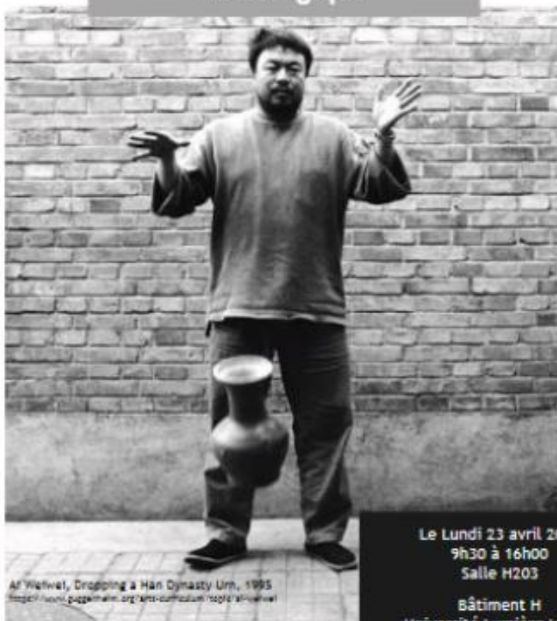
Al Weiwei, Dropping a Han Dynasty Urn, 1995 https://www.guggenheim.org/arts-curriculum/1995/al-weiwei