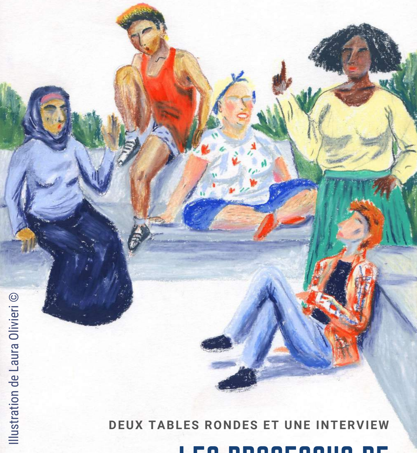
Illustration de Laura Olivieri ©